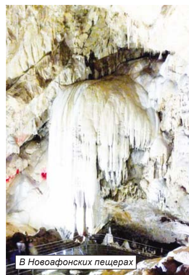
В Новофонских пещерах