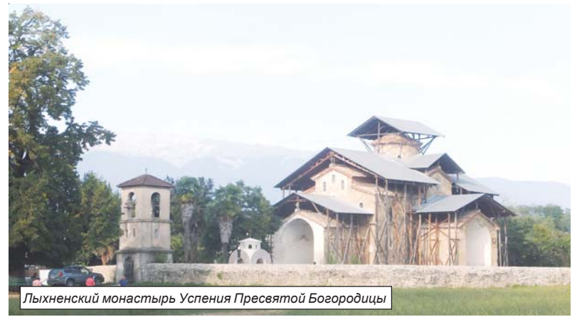
Лыхненский монастырь Успения Пресвятой Богородицы

кий спелеолог и скульптор Гиви Смыр. Неудовлетворённое любопытство юноши, который, можно сказать, только краешком глаза заглянул в бездну, привело его к спелеологам. И в том же году он вместе с учёными, изучающими пещеры, спустился на глубину больше 130 метров. Впервые люди оказались в гигантском подземном царстве, поразившем их воображение. Так и были открыты Новофонские пещеры, наибольшая глубина которых достигает 185 метров, общая протяжённость пещерного пространства - больше трёх километров. Туристическая тропа, оснащённая защитными стальными бортиками, составляет полтора километра. Специальная подсветка и музыкальное оформление - звучали произведения Баха - только усиливали впечатление от всего увиденного. За миллионы лет подземная река вымыла гигантские пустоты - можно ангары для самолётов разместить. Пространство удивляет всевозможными наростами причудливой формы и самой разной расцветки - в основном белой. Они повсюду, в виде со-