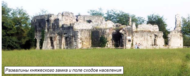
Развалины княжеского замка и поле сходов населения

Поселок Лыхны, где мы сделали остановку, - древняя столица Абхазского княжества, история которого насчитывает полторы тысячи лет.