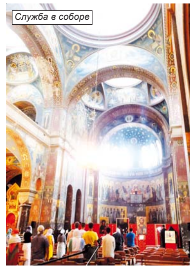
Служба в соборе

сулек, гребёнок, бахромы, горок, одна из которых сильно похожа на огромную голову с раскрытым ртом, другие - на каких-то инопланетных существ. Оранжевые, желтые и красные сосульки, свисающие с потолка и оживляющие подземные пейзажи, - сталактиты, а со дна пещеры поднимаются сталагмиты. В некоторых случаях они соединяются, и перед нашим взором возникает необы-