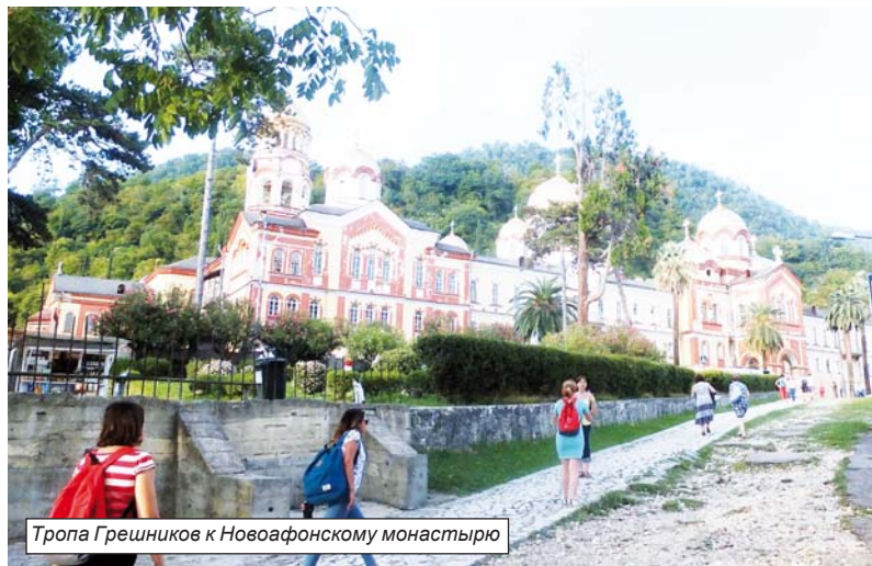
Тропа Грешников к Новофонскому монастырю

Сытно пообедав и попробовав абхазский суп, похожий на шурпу, название которого я не запомнила, ещё успели осмотреть и прилегающую к кафе территорию с множеством цветущих роз. Покинув Лыхны, мы уже