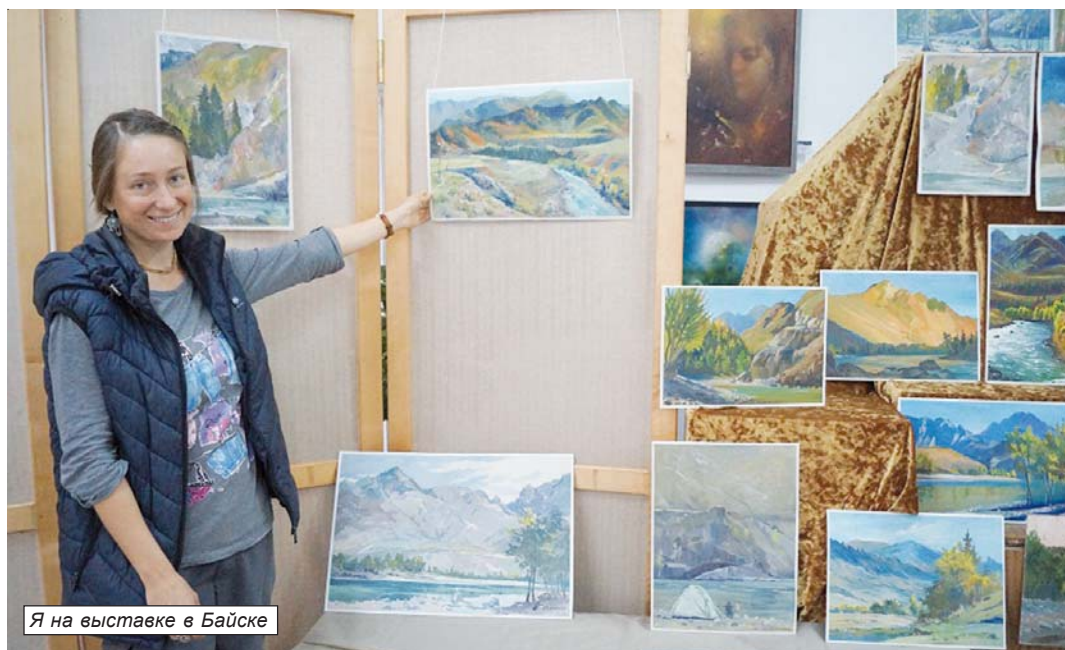
Я на выставке в Байске