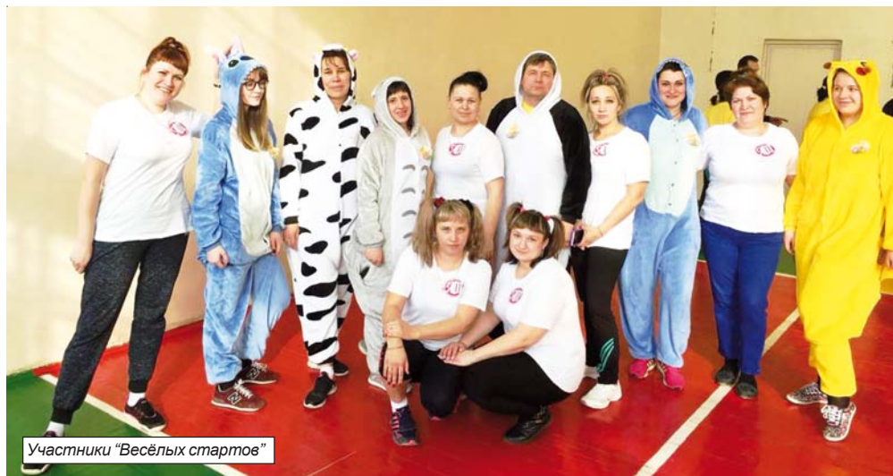
Участники "Весёлых стартов"