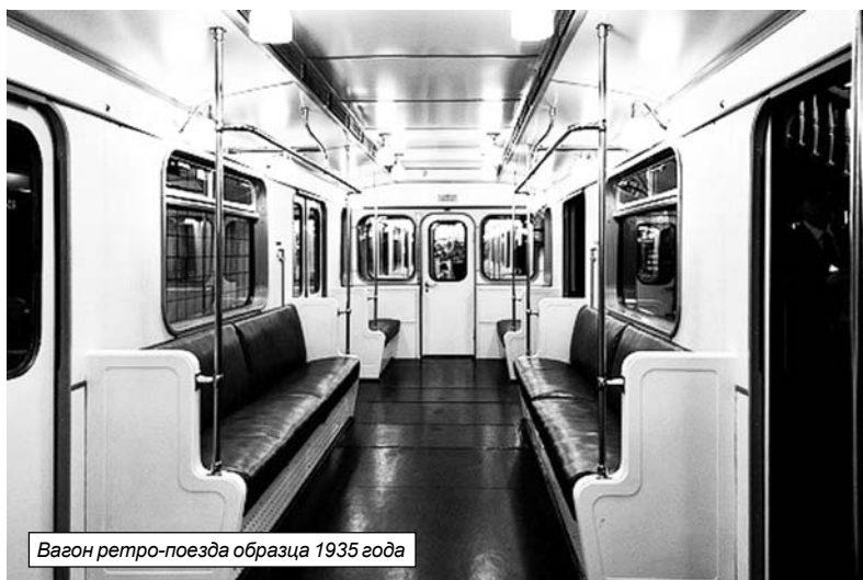
Вагон ретро-поезда образца 1935 года

Для окультивирования был выбран очень дорогой спектакль театра Ленком "Пер Гюнт" по мотивам одноимённой драмы Г. Ибсена в постановке Марка Захарова. Совершенно невероятная декорация-трансформер в виде чёрного куба, сложная сценография, как всегда живая музыка многочисленного театрального оркестра. Я не критик, но спектакль завораживает и поражает одновременно. Каждый метр сценического пространства, каждый сантиметр декорации обыгран. И как обыгран! В спектакле блистают Александра Захарова, Антон Шагин, Виктор Ракон, Сергей Степанченко... Одно слово - Ленком. Два слова - Марк Захаров.