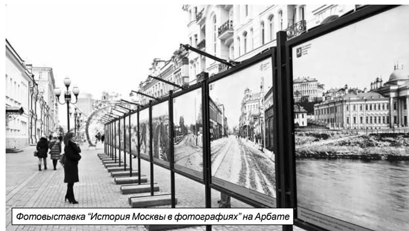
Фотовыставка "История Москвы в фотографиях" на Арбате

лос информатора: "Электропоезд такой-то отправится с такого-то пути... проследует до станции... со всеми остановками, кроме..." И голова от этого идёт кругом.