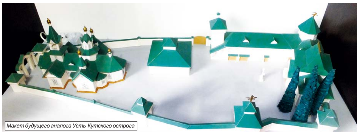
Макет будущего аналога Усть-Кутского острога